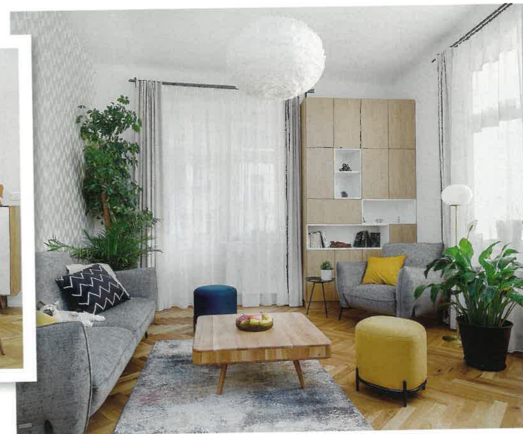
V místnostech s vysokými stropy a menším množstvím nábytku se často tvoří ozvěny, závěsy je však potlačí.

K dyž si rodina se dvěma malými dětmi pořizovala třípokojový byt