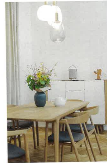
Zatímco samotný návrh proměny měla architektka hotový za 1,5 měsíce, dalšího zhruba půl roku trvala rekonstrukce a zařazení bytu.

Text: Marcela Škardová